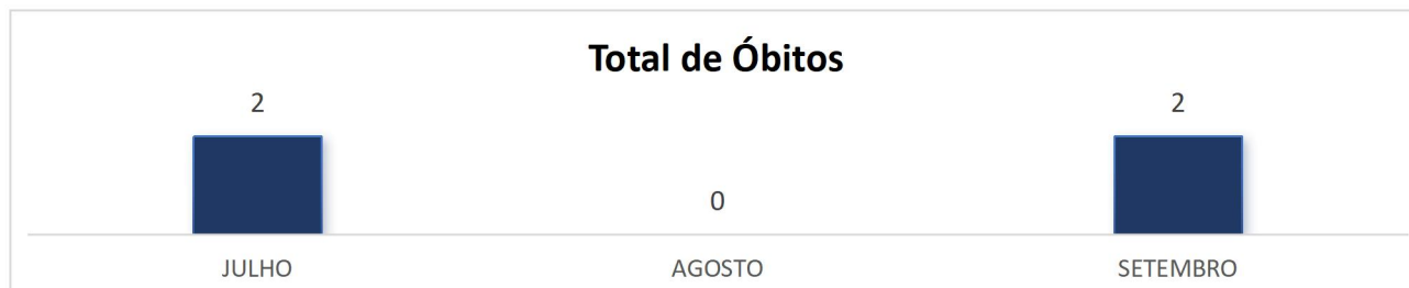
Gráfico 1. Número total de óbitos que ocorreram no HEAL de Julho a Setembro de 2024.