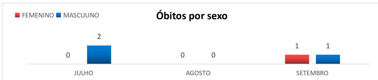
Gráfico 2. Número total de óbitos por sexo no período de Julho a Setembro de 2024 no HEAL